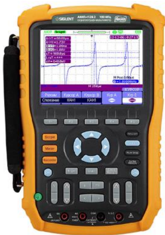
Рисунок 1. Фотография общего вида осциллографов-мультиметров

Фотография общего вида осциллографов-мультиметров представлена на рис. 1. Схема пломбировки от несанкционированного доступа изображена на рис. 2.