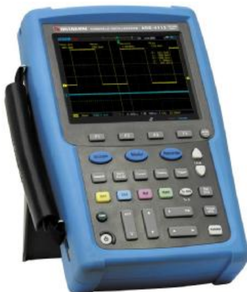
Рисунок 1. Фотография общего вида осциллографов

Фотография общего вида осциллографов представлена на рис. 1. Схема пломбировки от несанкционированного доступа изображена на рис. 2.